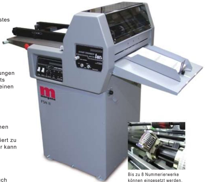
Bis zu 8 Nummerierwerke können eingesetzt werden.

Zusätzlich zu den Nummerierwerken kann die FSN II auch noch mit Werkzeugen zum Perforieren, Rillen und Schneiden ausgerüstet werden.