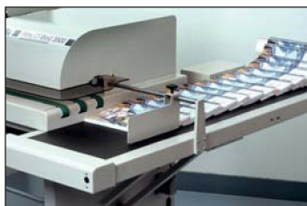
Reception of the books / Recepción de libros / Réception des ouvrages / Aufnahme der Büchern