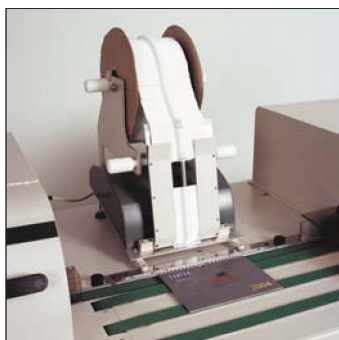
Optional hanger feeder Opcional dispensador de colgadores Optionnel : Distributeur de crochets Plug and play Aufhänger-Zufuhr