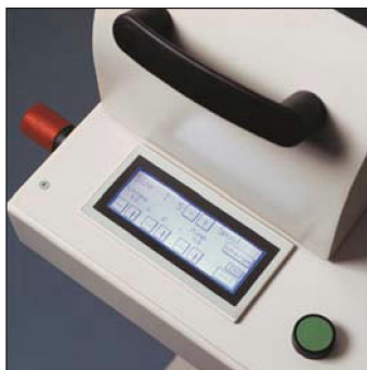
Easy to use touch screen Utilización fácil de la pantalla táctil Ecran de contrôle digital facile d'utilisation Einfache Touch-Screen-Steuerung